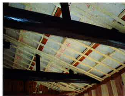
2階天井は勾配天井にして、梁を化粧に。