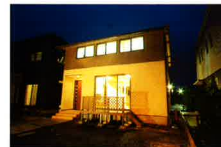
総2階、切り妻屋根・・・と、形状は極めてシンプル