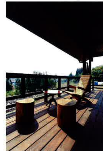
立山連峰を一望できる展望デッキ