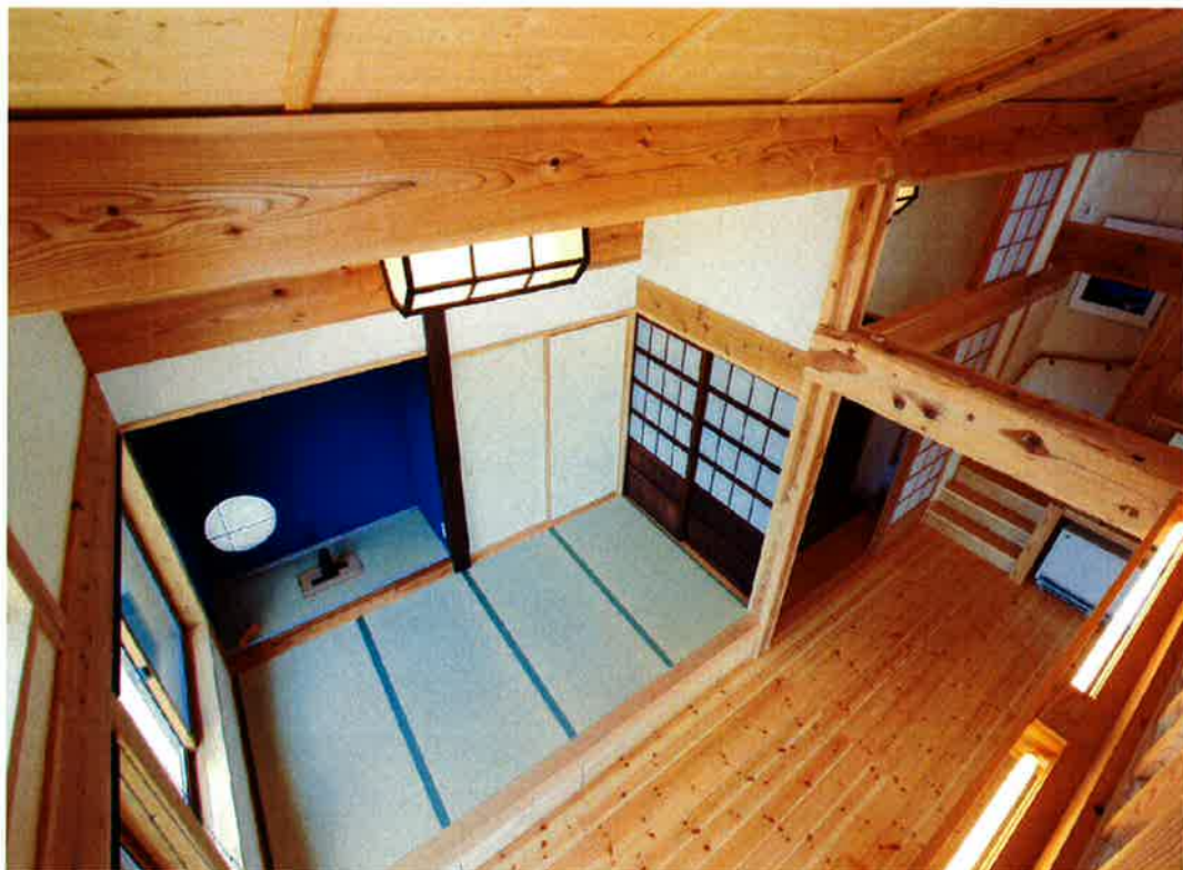
構造材には国産の杉を多用

里家…里家は2008年常設展示場として、富山市田園住宅開ヶ丘にて半年間公開されました。