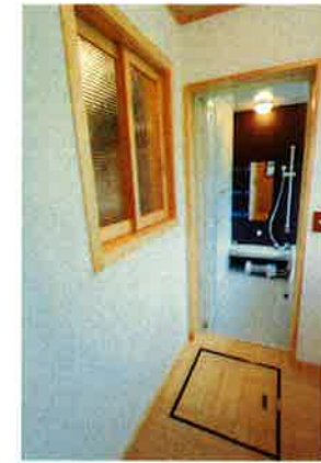
レトロ感のあるガラス小窓。