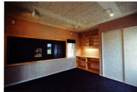
ご主人念願の音楽室もこの通り!