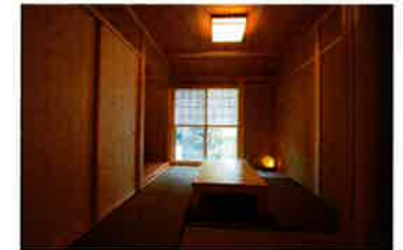
リビングの隣には和室を配置