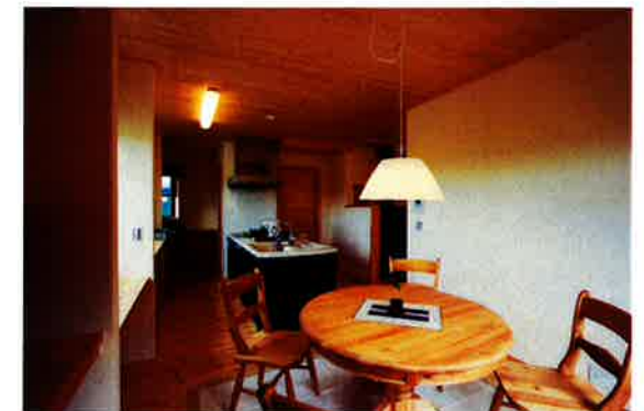
リビングから見えなくなっている、落ち着いたダイニング