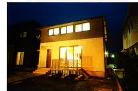
総2階、切り妻屋根・・・と、形状は極めてシンプル