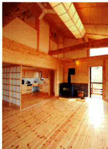
古い田植え器具をリビングの主照明に