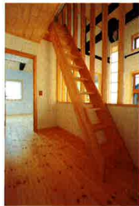
屋根裏スペースを利用してロフトに