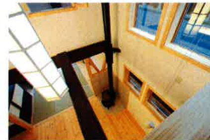
さっきの梁はここに出てきました。