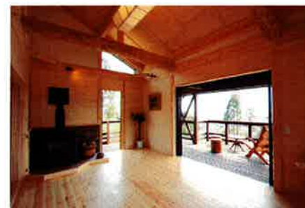
冬は薪ストーブ1台でOK。