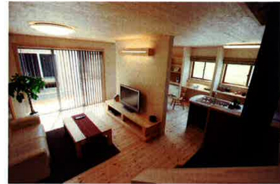
中心に壁を配置することで、それぞれの場所を活かす