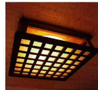
炬燵の古材を照明器具にリメイク