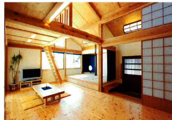
所々に溶け込んだ古材がどこか懐かしい空間を造り出している