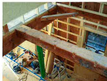
骨太な丸太梁が現れました。これが…