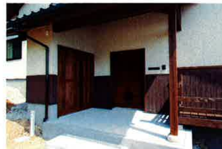
玄関は里家のトレードマークとなった『蔵戸』