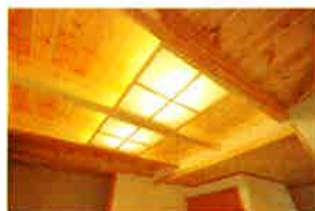
オリジナル造作照明