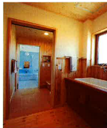
素朴でウッディなサニタリー