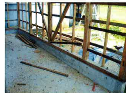
再利用できる柱と基礎は残し、壁を解体。