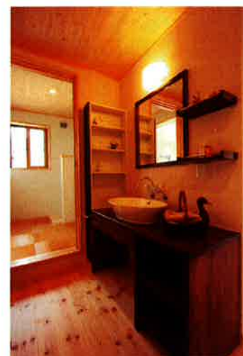
オリジナルの造作洗面