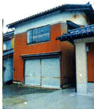
「車庫兼納屋として長年使っていました」