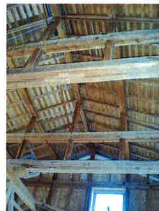
この高さを活かして、2階+ロフトを計画。