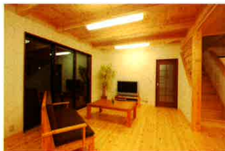
22畳のLDKは、木の温もりがたっぷりです