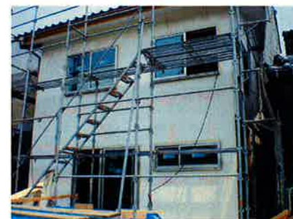
家ごとすっぽり断熱材で包みました。