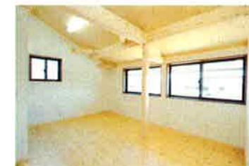
2階はすべて板貼りの勾配天井