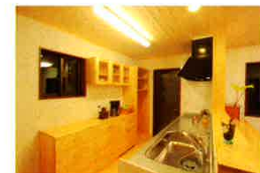
オプションの造作家具もベストマッチ