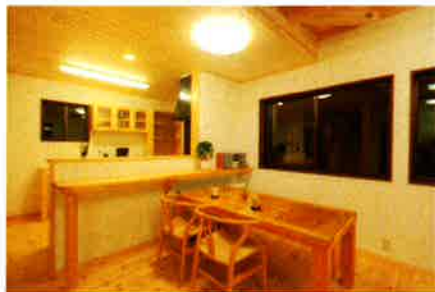
オープンなレイアウトのダイニングキッチン

間取りをシンプルにすることで、高耐久&高品質ながら 本体価格 1500万円 という、コストパフォーマンスを実現。 長年のノウハウが詰まった、ほんものの木の家がこの価格でお求め頂けます。