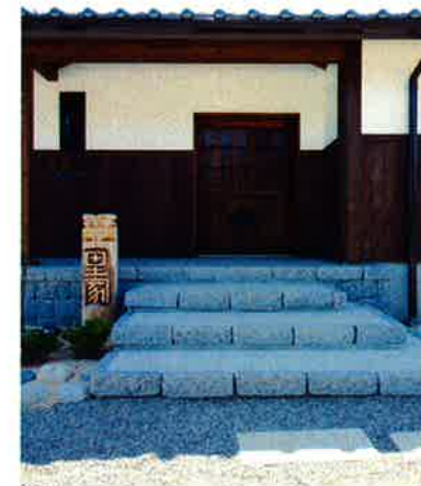
玄関戸に古い蔵戸をリメイク