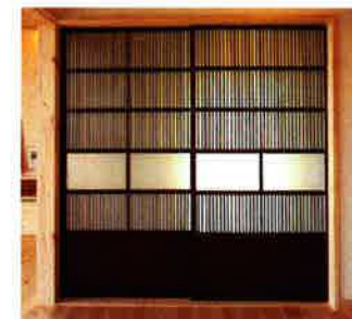
千本格子が美しい古建具