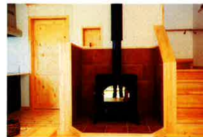
自慢の薪ストーブはダッチウエスト