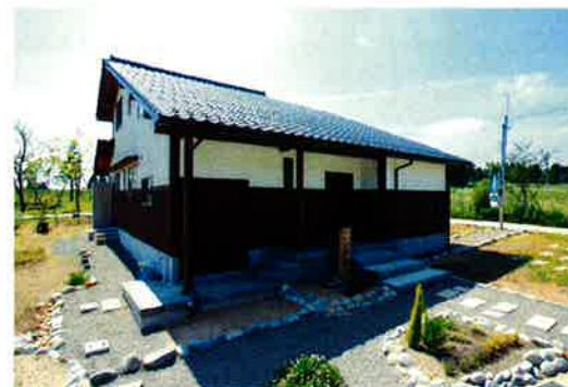
低く構えた大屋根がダイナミックなフォルムを演出している