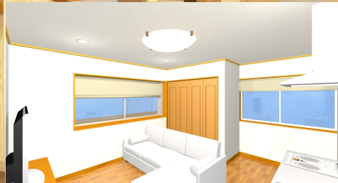
2階洋室完成イメージ図