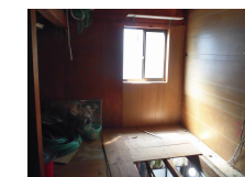
リフォーム前の小屋裏空間

2階に若夫婦の居住空間としてトイレ、洗面台、ミニキッチンなどの水回りを設置。空間を有効に活用するため、小屋裏のスペースを利用してトイレ、洗面台、収納を効率良く配置しました。間取り変更も少なく建築コストも抑えられました。