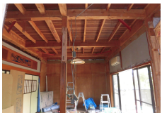
1階天井を取り除いた様子(2階床面) 空間を高く見せる工夫をした天井

リフォーム前の和室は天井高が低いため、天井高を少しでも高くして開放感を出すために、梁を見せて2階の床面との間の空間をギリギリ使って天井高を確保しました。また、天井裏が屋根になる箇所では屋根裏を利用して吹抜も設置しました。