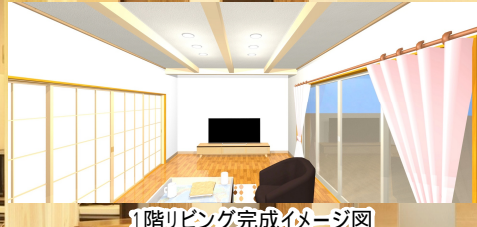
1階リビング完成イメージ図