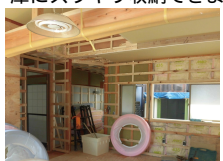
改装のキッチン空間

キッチンに隣接する和室の広縁を食品庫として改装。対面式キッチンの横から利用できるので家事動線も良く、とても便利です。鍋や食器、食品のストックなどで狭くなりがちなキッチンスペースをたっぷり収納できる食品庫にスッキリ収納できます。