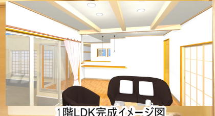
1階LDK完成イメージ図