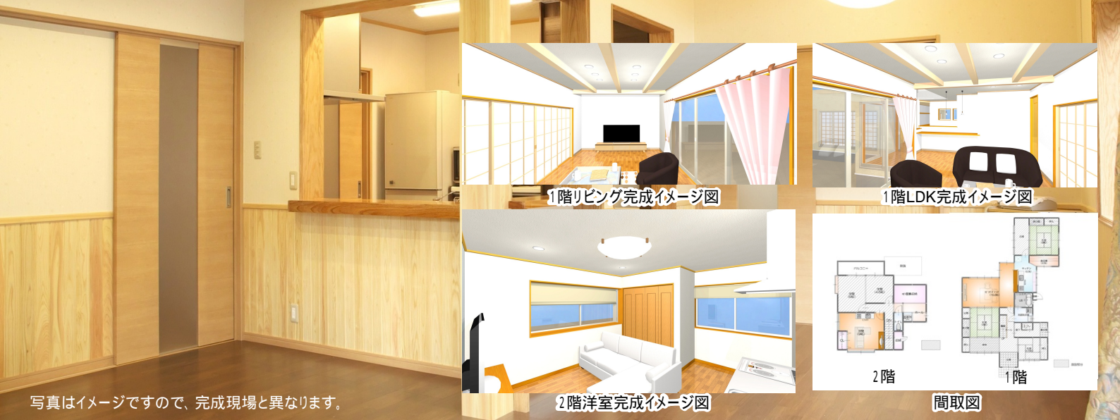
写真はイメージですので、完成現場と異なります。