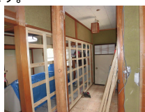
食品庫に改装する広縁