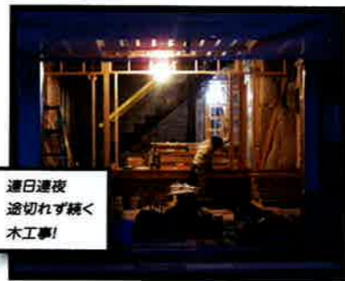
連日連夜 途切れず続く 木工事!