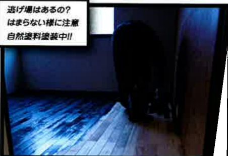
逃げ場はあるの? はまらない様に注意 自然塗料塗装中!!