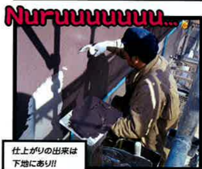
仕上がりの出来は 下地にあり!!