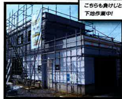
こちらも負けじと 下地作業中!