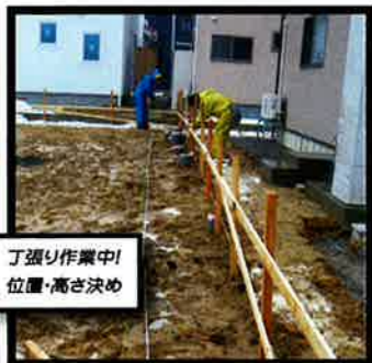
丁張り作業中! 位置・高さ決め