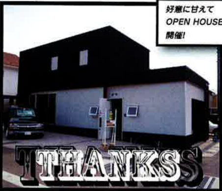
好意に甘えて OPEN HOUSE 開催!