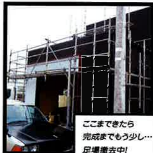
ここまできたら 完成までもう少し... 足場撤去中!