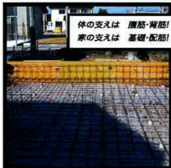
体の支えは 腰筋・背筋! 家の支えは 基礎・配筋!