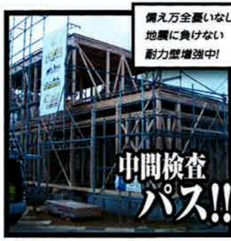
備え万全でない 地震に負けない 耐力壁増強中!