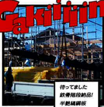
待ちました 鉄骨階段納品! 半艶精鋼板