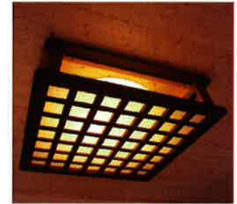
炬燵の古材を照明器具にリメイク