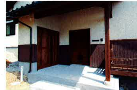
玄関は里家のトレードマークとなった『蔵戸』