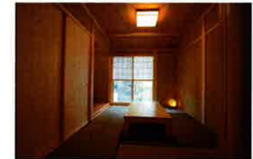
リビングの隣には和室を配置