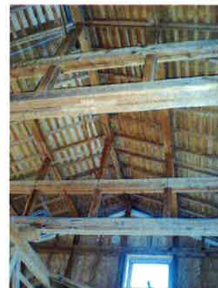
この高さを活かして、2階+ロフトを計画。