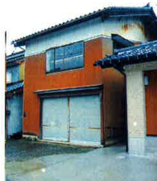
「車庫兼納屋として長年使っていました」