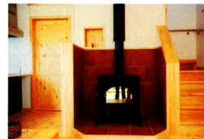
自慢の薪ストーブはダッチウエスト