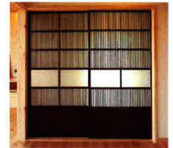
千本格子が美しい古建具