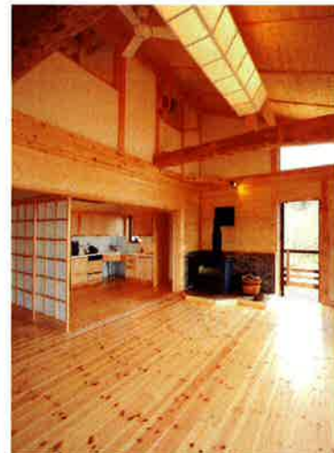
古い田植え器具をリビングの主照明に