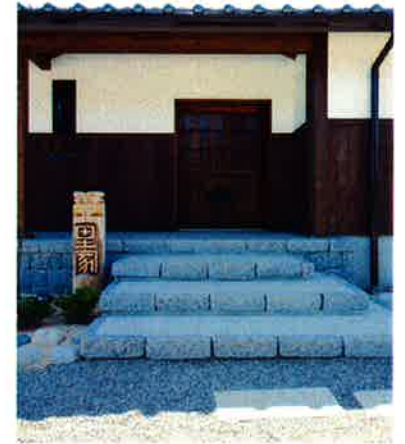
玄関戸に古い蔵戸をリメイク