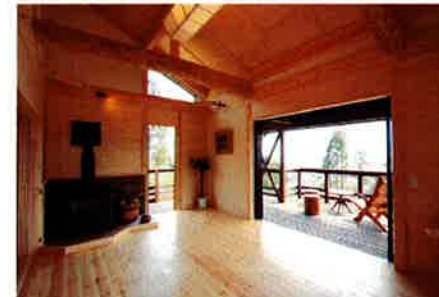
冬は薪ストーブ1台でOK。