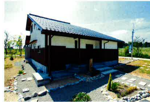
低く構えた大屋根がダイナミックなフォルムを演出している