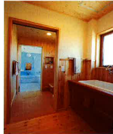
素朴でウッディなサンタリー