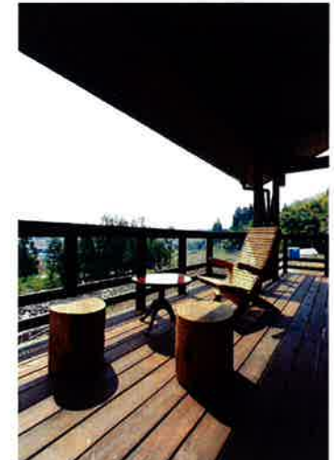
立山連峰を一望できる展望デッキ