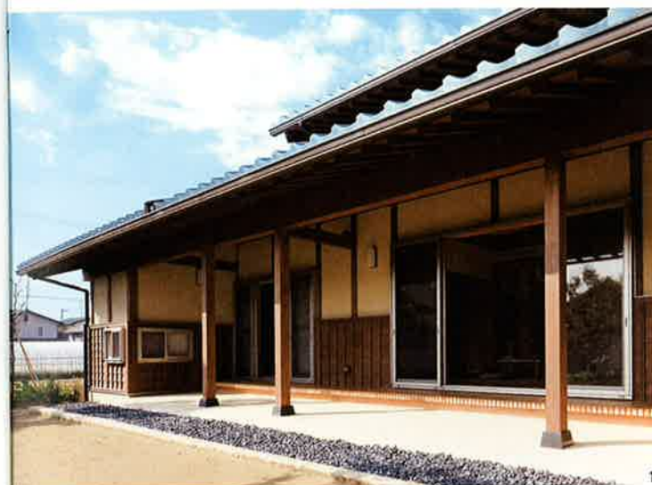
1.濡れ縁の下は、素朴で味わいがある土間たたき。通常はコンクリートで済ませる所にも、ご主人の要望がきちんと生かされた。

サンルームはよく風が通り、暖かくもあるので、洗濯物がよく乾く。物干し場ではあるが、居心地もいい。