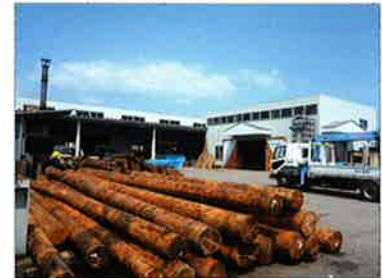
自社プレカット工場