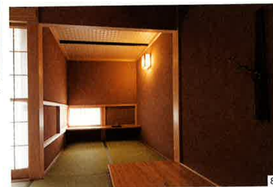
8.和室に作られた書斎は、天井を下げ、落ちてくる空間に。角の両側が窓になっているので、日中は自然光だけで読書が可能。