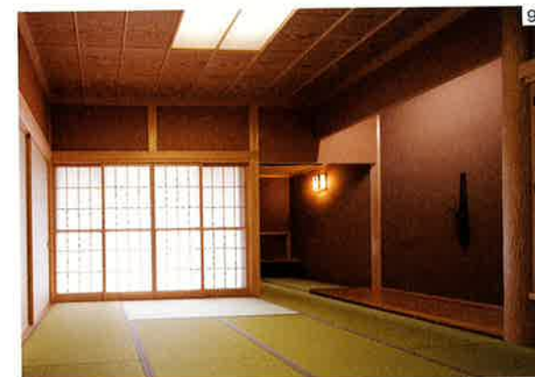
9.床の間を低くしたせいか、空間全体がすっきりと見える。温かみのある上品な色が選ばれた塗り壁には、ワラが入っている。