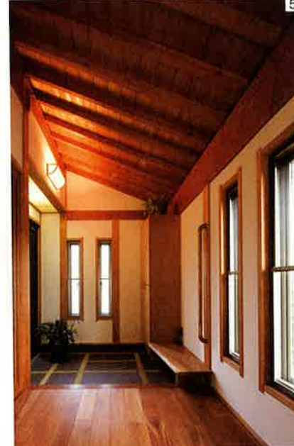
5.屋根の傾斜を生かした天井が、空間の面白みにもなっている。ホールにはガラスが入っていて、玄関からも縁側が見える。