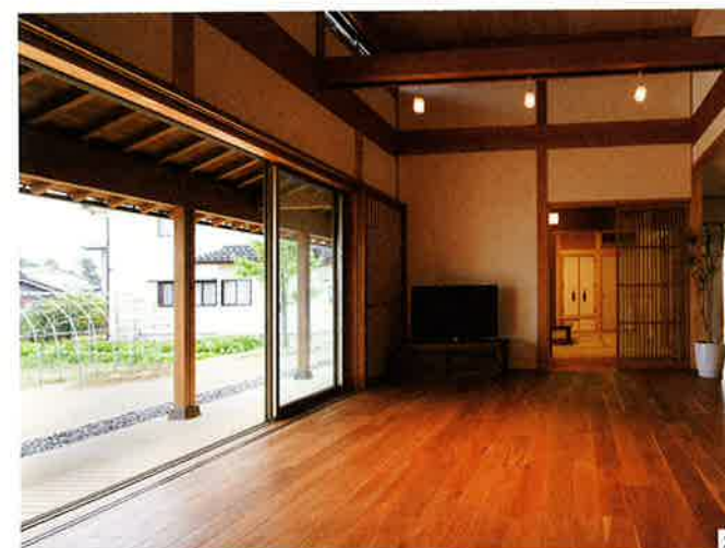
2.リビングの大開口から眺める庭は、格別だ。軒がかなり大きく出ているので、多少の雨でも窓は開けておける。