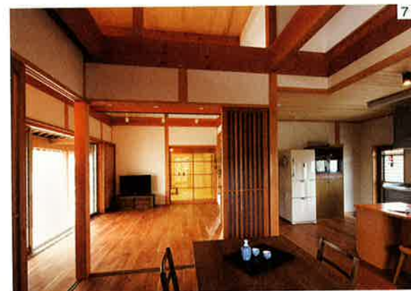
7.仕切ることのできるダイニング。柱や梁には柿渋が塗られ、壁には珪藻土を使うなど、健康的な素材が選ばれている。

平成3年には法人化し、「有限会社ナカムラ」に。平成4年には、製材・加工のための自社工場も完成しました。八尾にいた頃は、切り出した木を刻む様子なども見ており、大変興味を持っていました。木の見極めにも問題はありませんでした。工場ができたことで、住宅メーカーのようにパターン化することなく、いろいろな材料が思うように作れ、すぐ挽いてすぐ使えるというメリットも生まれました。やがて、大学で建築を学び、設計事務所などで働いていた3代目・満が入社。営業・設計・積算・アフターフォローまで、幅広く受け持つようになりました。 これまで、「お客様に喜んでほしい」との思いひとつで、一生懸命、真面目に家づくりに取り組んできました。同じお客様の家を2度建てたり、親子3代の家をすべて手がけたりと、お客様に育てていただいた会社とも言えると思います。 これからも、初代から続く変わらぬ想いと職人技で、励んでまいります。