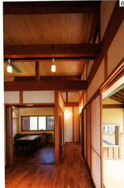
6.床はアメリカンブラックチェリー、天井はヒノキ。床にはワックスではなく、天然の亜麻仁オイルが塗られている。