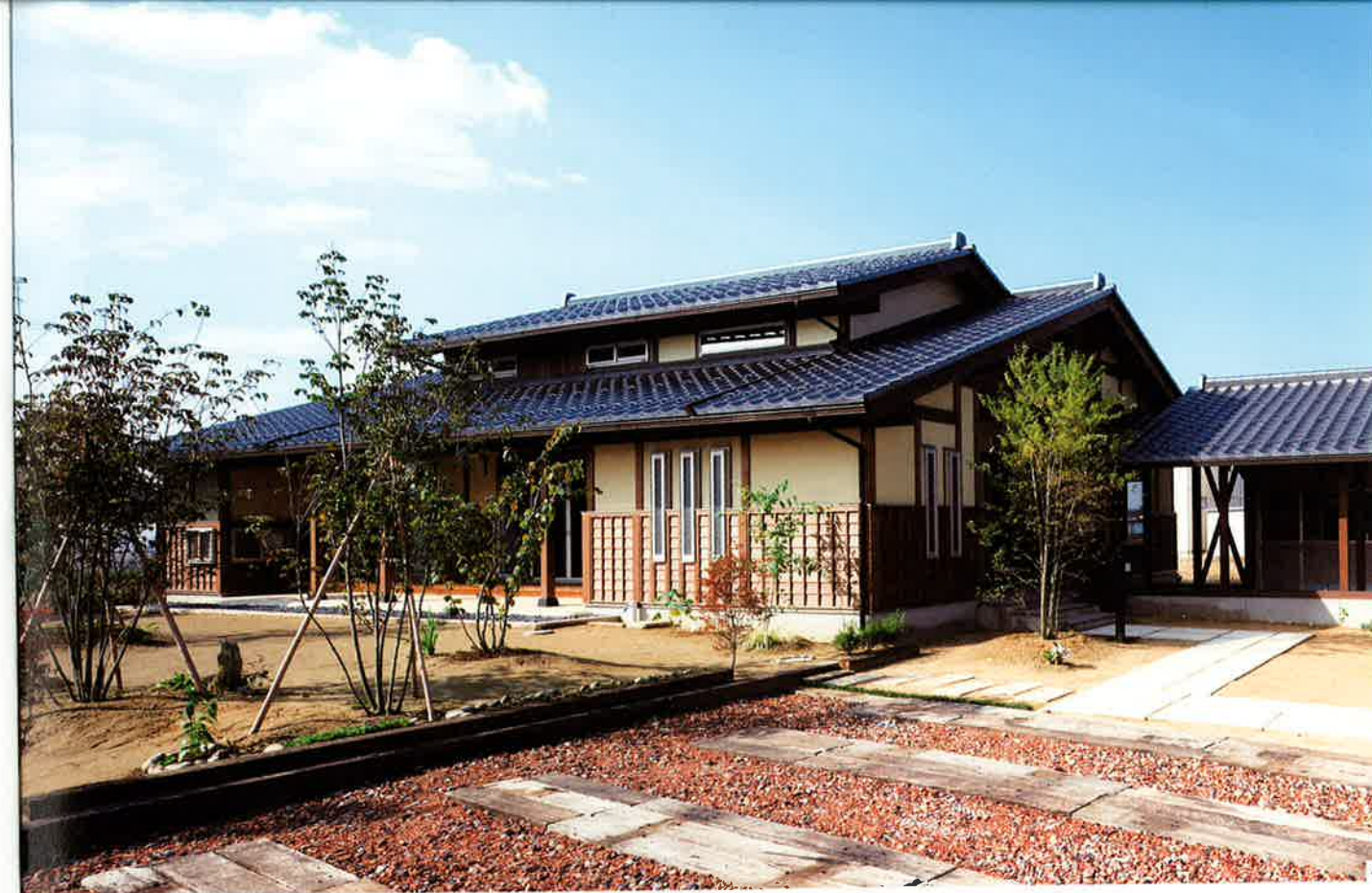
4.棟上の隠屋根が、いいアクセントになっている。西日が当たる面には、将来のメンテナンスを考え、サイディングを使用。

濡れ線や土間の幅、高さなどを工夫し、リビングの床に座った状態でも、縁側ごしに、美しく仕上げられた土間たたきが見られるようにプランされた。軒の垂木もよく見える。