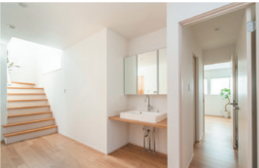
親子世帯の居住空間は広々とした1階ホールから繋がります。