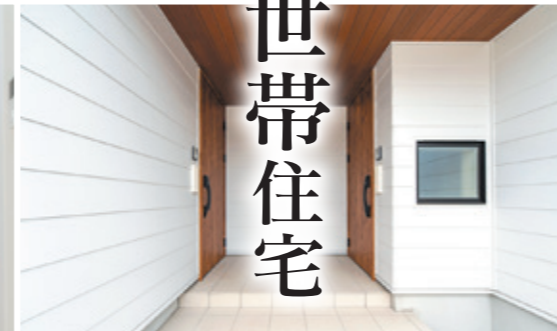
お互いの生活リズムの違いに配慮した左右2カ所の玄関ドア。