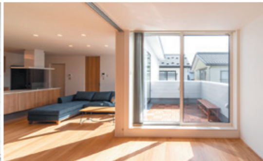
周囲を気にせずバーベキューを楽しめるプライベートテラス。