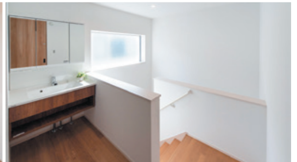
明るい2階ホールには子世帯用の洗面スペース。