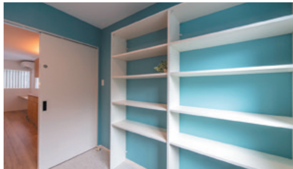
キッチンに隣接したパントリーなど豊富な収納スペース。