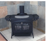
設置前の薪ストーブ

サンクンリビングの書斎スペースの隣には薪ストーブが設置されており、吹き抜けで2階も暖かくなります。古民家の梁がリビングから見え、薪ストーブととてもマッチした雰囲気空間になっています。